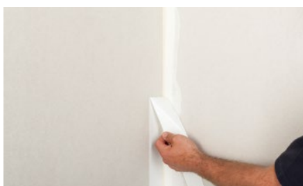
8. Prečnievajúcu pásku stiahnuť