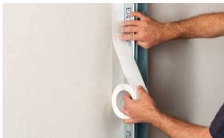
2. Nalepte Trenn-Fix vedľa profilu