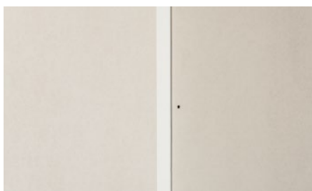
5. Sadrokartónovú dosku montovať vo vzdialenosti od steny 5 mm