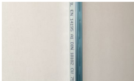
1. Namontujte profil k existujúcej konštrukcii

Pri nasledujúcich maliarskych prácach je nutné prevziať (dodržať) v oblastiach napojenia vytvorenú deliacu škáru. Prečnievajúcu pásku Trenn-Fix včas odstrániť.