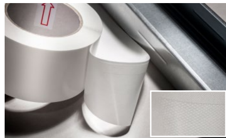
3. Úzky lepiaci pás pásky je potrebné priložiť tesne k profilu