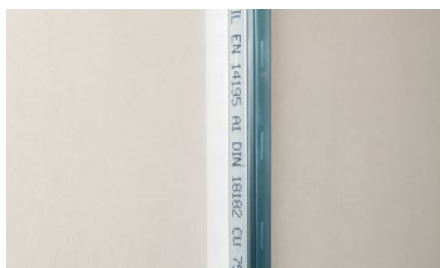
4. Trenn-Fix pritlačte a vyhladte