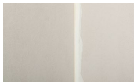
9. Trvalo fungujúce napojenie priliehajúcich konštrukcií